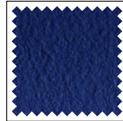
blau / bleu royal / blue