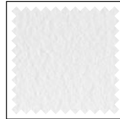
weiss / blanc / white