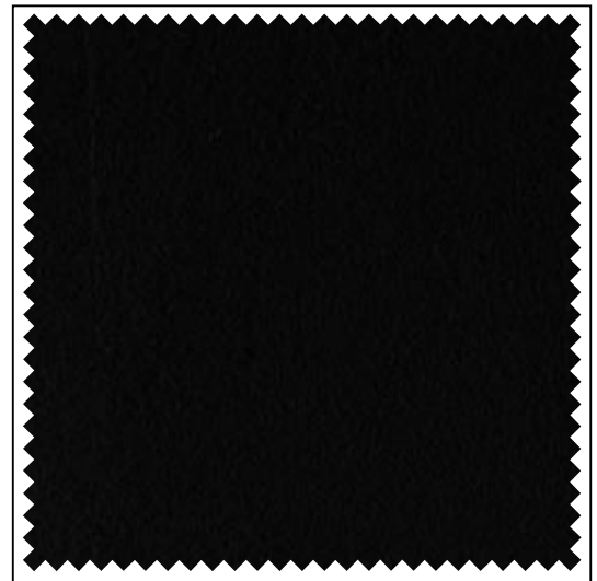
schwarz / noir / black