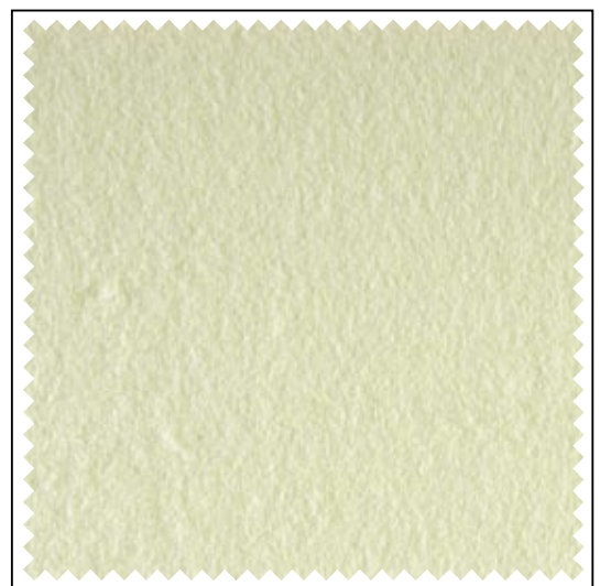
rohweiss / écru / ecru

B1: Schwer entflammbar nach DIN 4102 B1 (Stand: 06/2005).