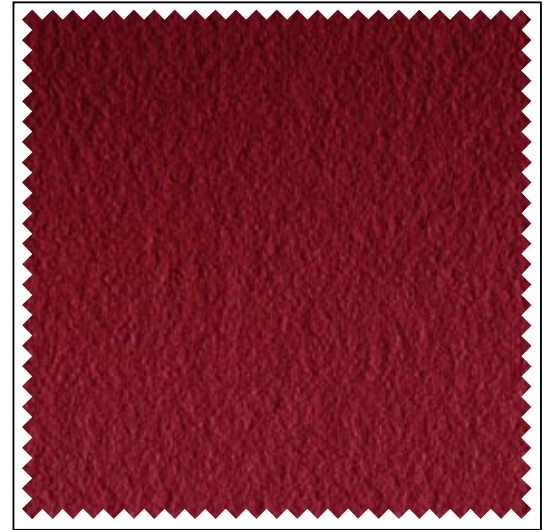
rot / bordeaux / red