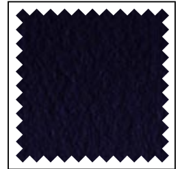
d. blau / bleu foncé / d. blue