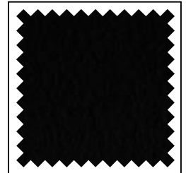
schwarz / noir / black