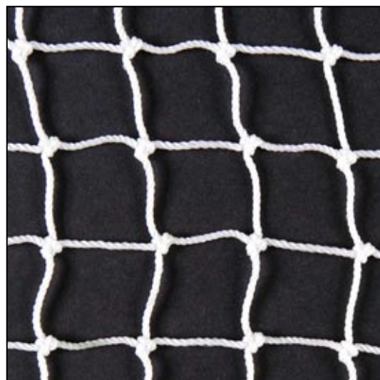
weiss / blanc / white