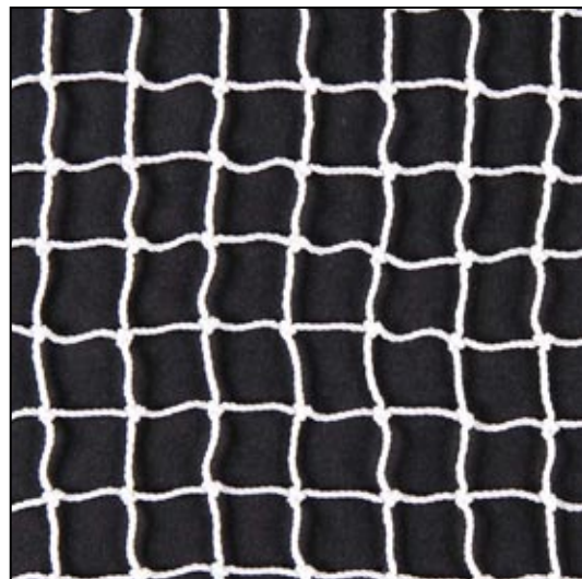
weiss / blanc / white

Alle Bühnennetze und Gazennetze sind appetiert, gespannt und quadratisch gesetzt.