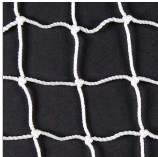
weiss / blanc / white